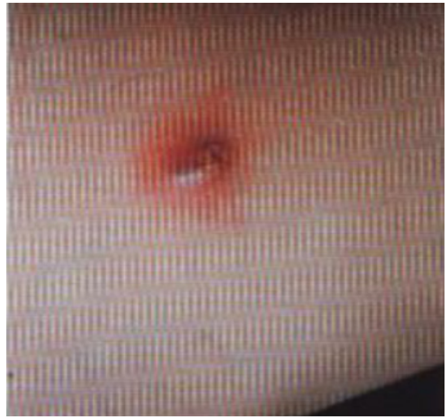
Fig. 4 - Mordedura de carraça