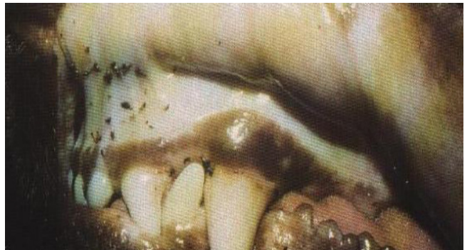
Fig. 1 – Mucosas pálidas (anemia)

Quase todas estas doenças têm em comum: febre, anemia (Fig.1), prostração e falta de apetite, algumas podem ainda causar dores articulares, O meu cão pode transmitir-me Febre da carraça?