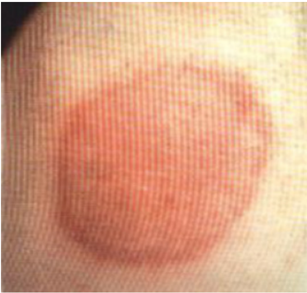
Fig.3 - Eritema migrans

Embora a transmissão seja principalmente por picada, em alguns casos o contágio pode fazer-se ao retirar com as mãos uma carraça da pele do cão.